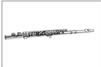
Querflöte (ca. 580€)

Folgende Instrumente sind für die Bläserklasse wählbar: