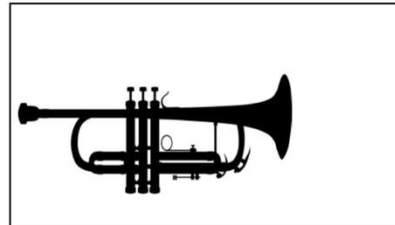
Trompete (ca. 690€)