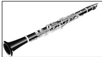
Klarinette (ca. 1150€)